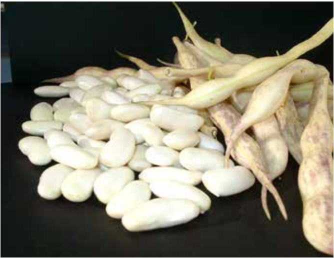
Investigadores del equipo de Genética Vegetal del Serida publican una primera versión del genoma de Faba Granja Asturiana, variedad Andecha

Este conocimiento también permitirá identificar con mayor precisión las características genéticas propias de la legumbre asturiana, que no siempre se reflejan en el genoma de referencia de la especie, y